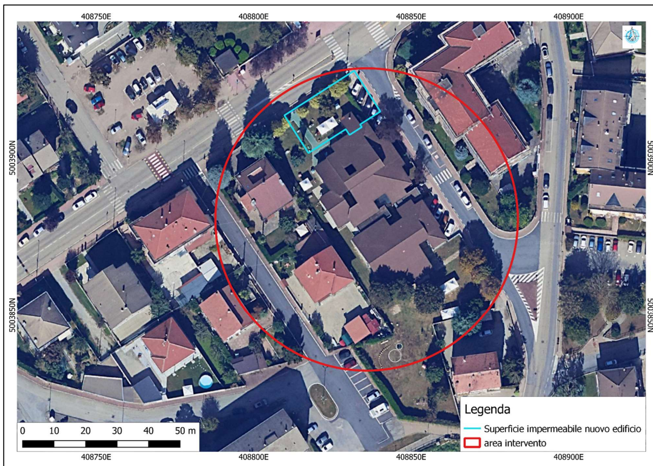
Figura 3 - Perimetrazione superficie impermeabile nuovo ampliamento in progetto.

Considerando quindi una superficie impermeabile con estensione pari a 562.11 \text{ m}^2 è possibile calcolare, mediante l'applicazione della formula riportata precedentemente, la portata generata, la quale rappresenta il parametro da utilizzare in sede di dimensionamento e verifica delle opere in progetto. I risultati di tale calcolo sono riassunti nella tabella sottostante.