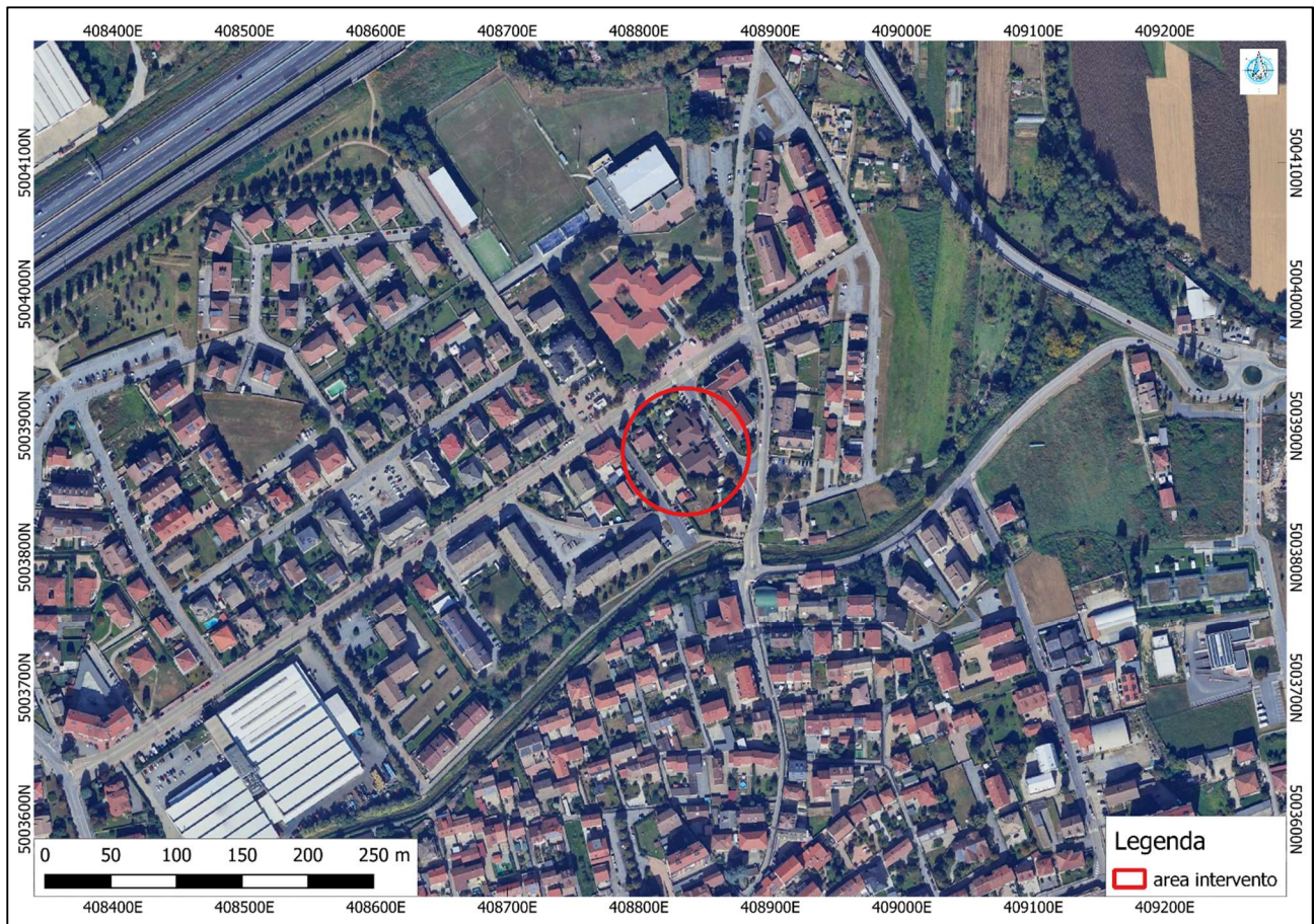
Figura 1 - Inquadramento area di intervento.

L'area di intervento è situata nel territorio comunale di Brandizzo, comune facente parte della Città Metropolitana di Torino di circa 8 670 abitanti e caratterizzato da un'estensione di 6.29 km 2 . Nell'immagine sottostante si riporta un inquadramento dell'area oggetto di intervento.